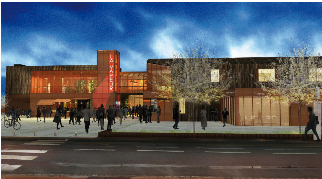
Le traitement des espaces extérieurs, la création d'un parvis sur l'avant et la végétalisation ouvriront La Vapeur sur l'espace public

Le projet propose en outre une grande fonctionnalité, la rationalisation des espaces, beaucoup de modularité et de souplesse d'utilisation.