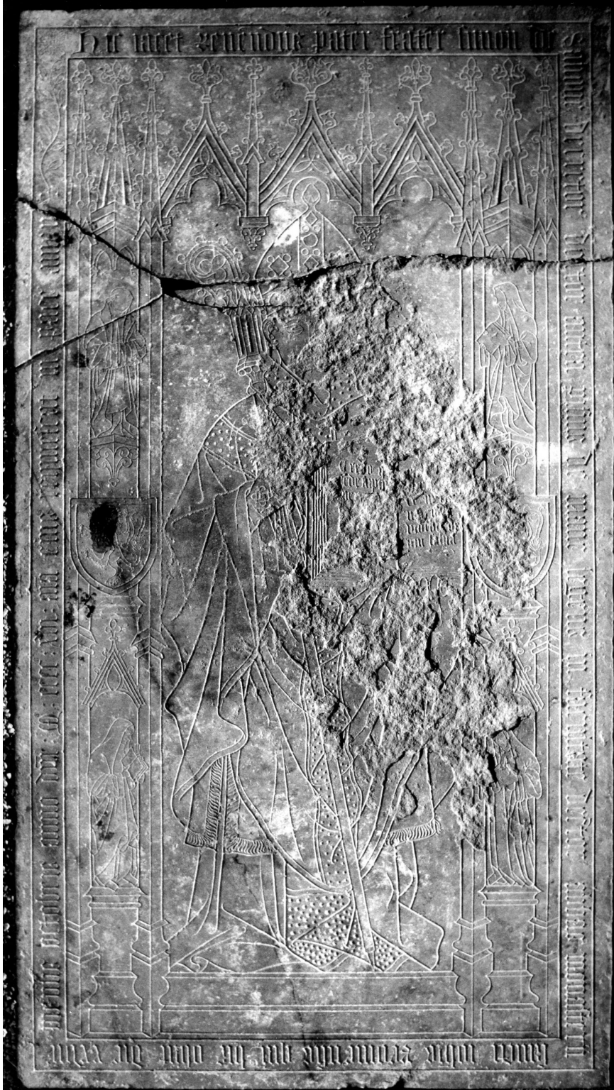
Dalle funéraire de Simon de Saulx Première quart du XVe siècle Provient de Dijon, Saint-Bénigne Calcaire L. 271,5 x l. 144,5 x ép. 30 cm Inv. 63.1