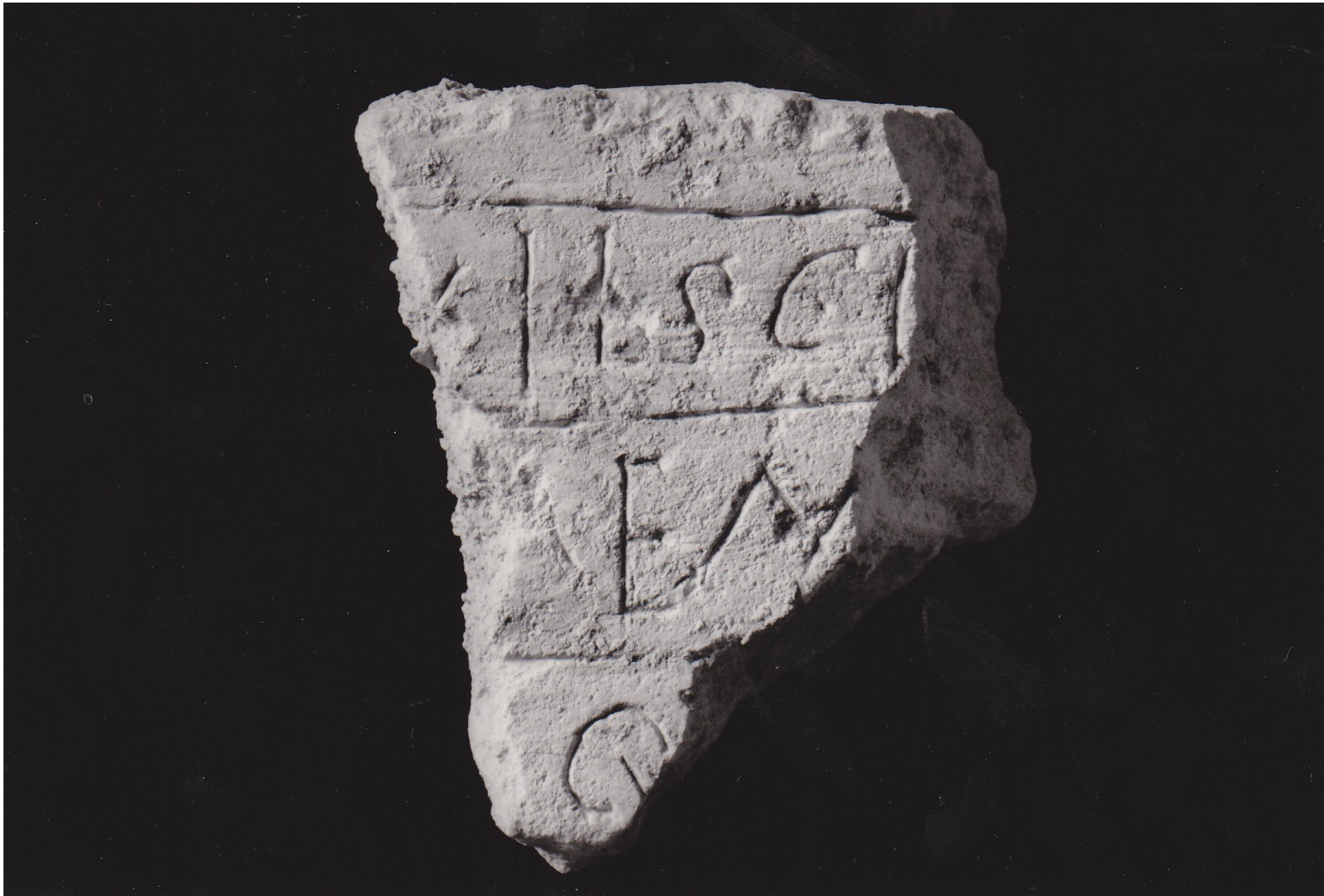
Fragment d'inscription VIe-VIIe siècle Provient de Dijon, Saint-Bénigne Calcaire gravé L. 12 x l. 15 x ép. 5,5 cm Inv. 63.11