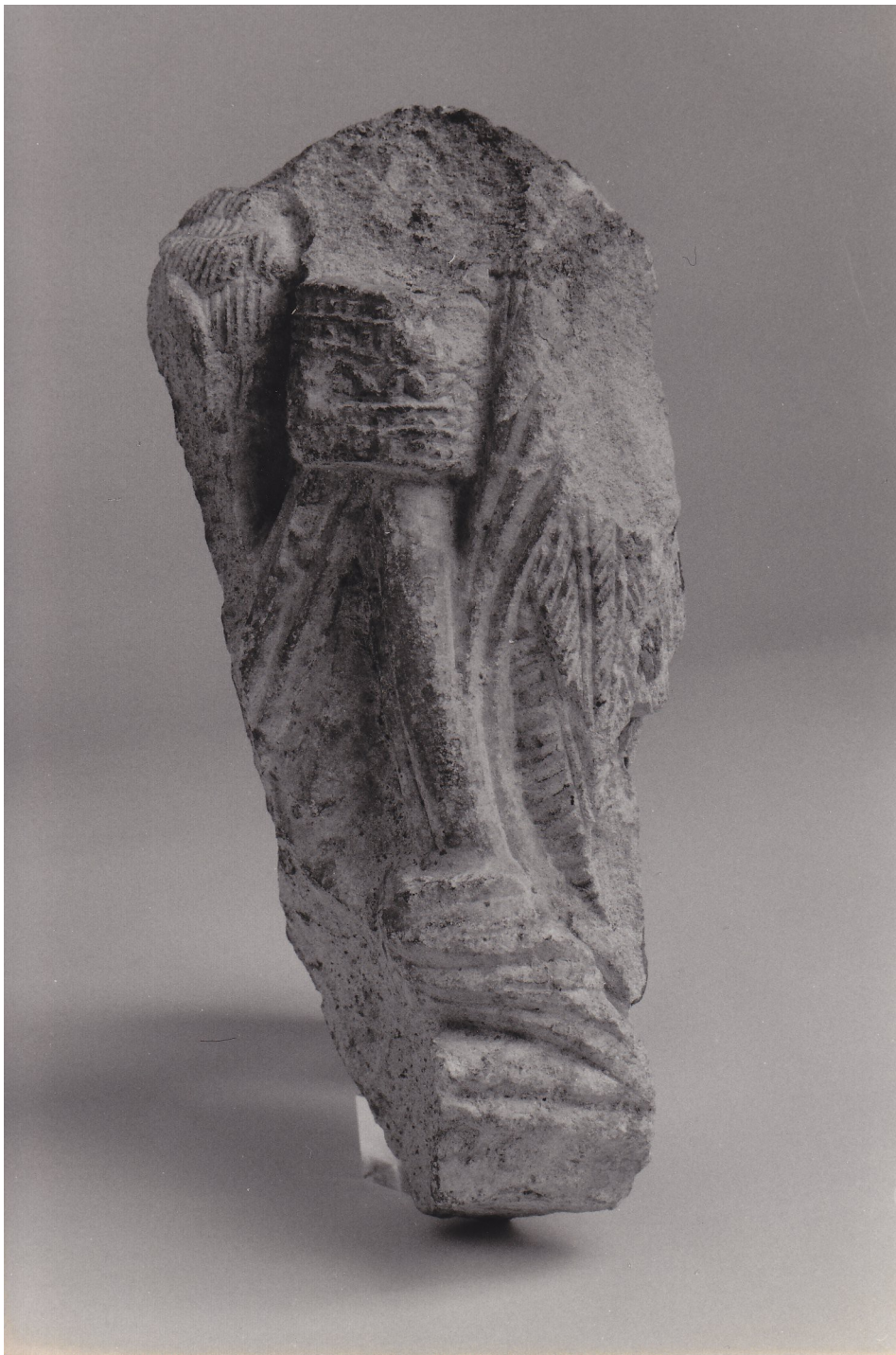
Fragment de chapiteau Troisième quart du XIIe siècle Provient de Dijon, Saint-Bénigne Portail occidental disparu ? Calcaire L. 22,5 x l. 13 x ép. 13 cm Inv. 63.13