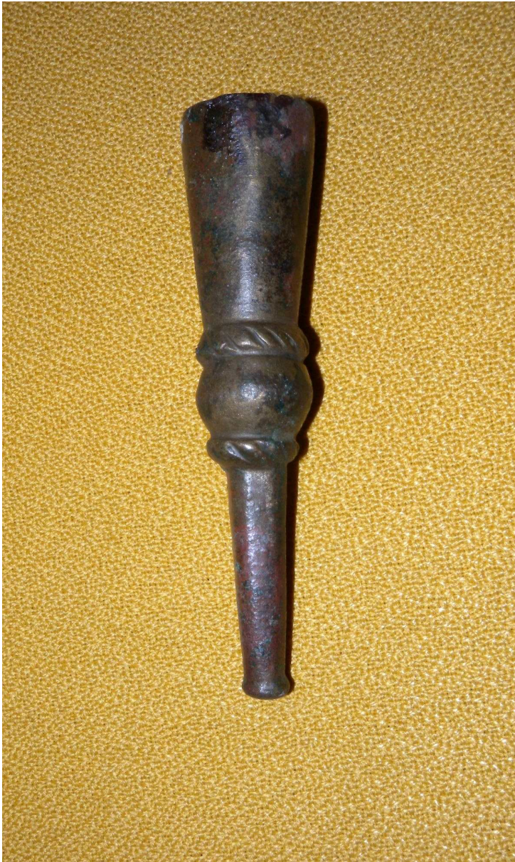
Base de crosse ou de tau Tombe de Simon de Saulx Alliage cuivreux H. 10 x l. 2,1 cm Inv. 63.9