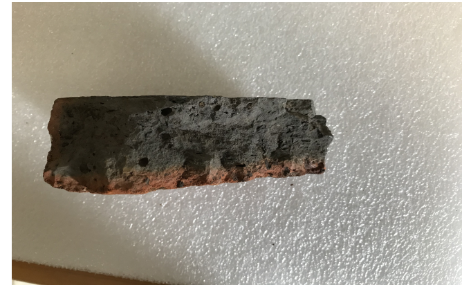
Lot de 4 fragments de carreaux incisés XIIIe-XIVe siècle Proviennent de Dijon, Saint-Bénigne Terre cuite, traces de glaçure Environ 14 x 11 cm x 5 cm.