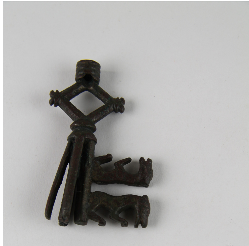
Clé à panneton et chiens adossés Tombe de Simon de Saulx Bronze Inv. 63.8