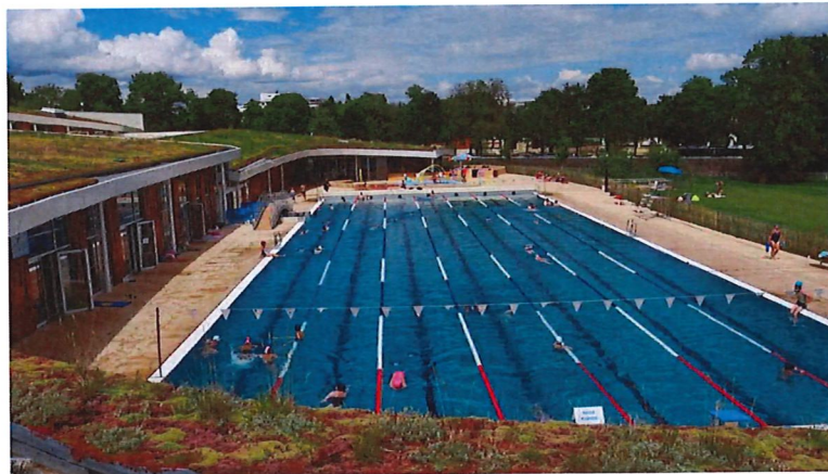
La piscine du Carrousel à Dijon.

La Piscine olympique étant fermée tout l'été, la plupart des Dijonnais se retrouveront à la piscine du Carrousel pour aller piquer une tête. Reconnaisable par l'originalité de son architecture, la piscine du Carrousel est un lieu prisé autant par les familles que les sportifs . À l'étage, on retrouve même un espace musculation ainsi que des salles pour les cours collectifs.