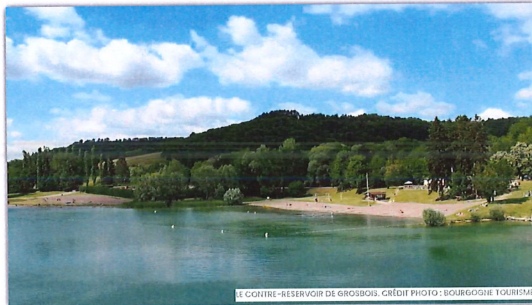
LE CONTRE-RÉSERVOIR DE GROSGOIS.