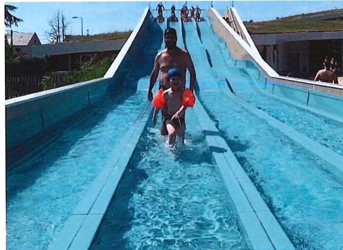
Profitant d'une météo estivale, le pentagliss de la piscine du Carrousel a rouvert samedi 27 mai, pour le plus grand bonheur des petits... et des plus grands !

Des rires d'enfant, des cris de joie et des éclaboussures. Samedi 27 mai, 15 heures viennent de sonner lorsque nous posons, sous un soleil de plomb , un orteil dans l'enceinte de la piscine du Carrousel, cours du Parc à Dijon. Plongée dans un doux bouillonnement estival. Un avant-goût des vacances après la grisaille du mois de mai (-15 % de fréquentation par rapport à l'an dernier).