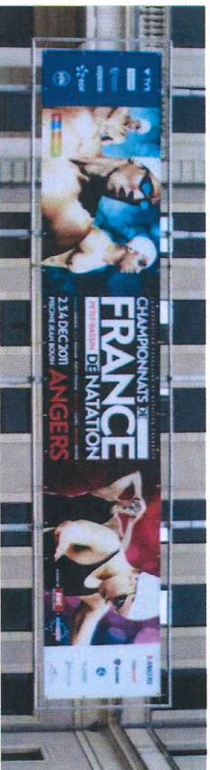
Bâche Hôtel de Ville