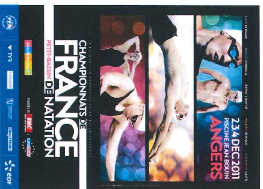
Affichage réseau ville + commerçants (500 exemplaires)