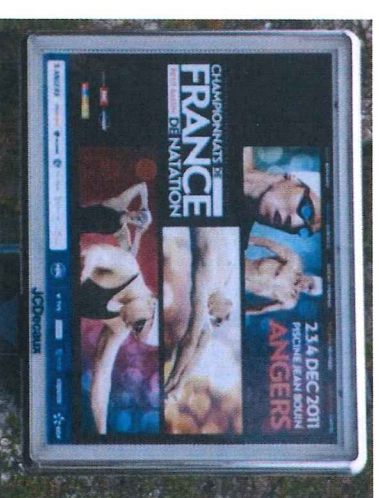
Affichage « Decaux »