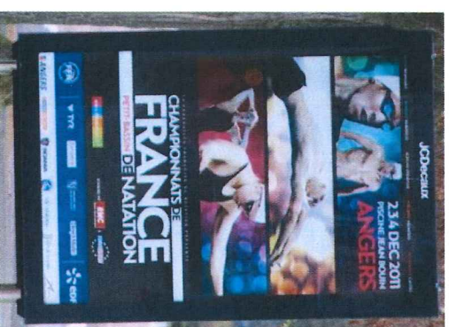
Affichage « Decaux »