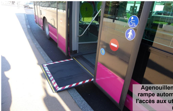
Agenouillement du véhicule et rampe automatique pour faciliter l'accès aux utilisateurs de fauteuil roulant.