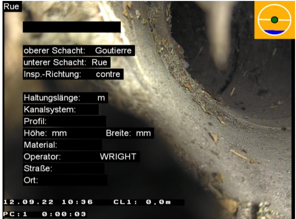
Photo 001 Vidéo 00:00:03 Distance amont 0,00 m État BCD.C Position Support de donnée

Pos: 12 - 12; Racines, grosse racine isolée, Réduction de la section transversale = 50%