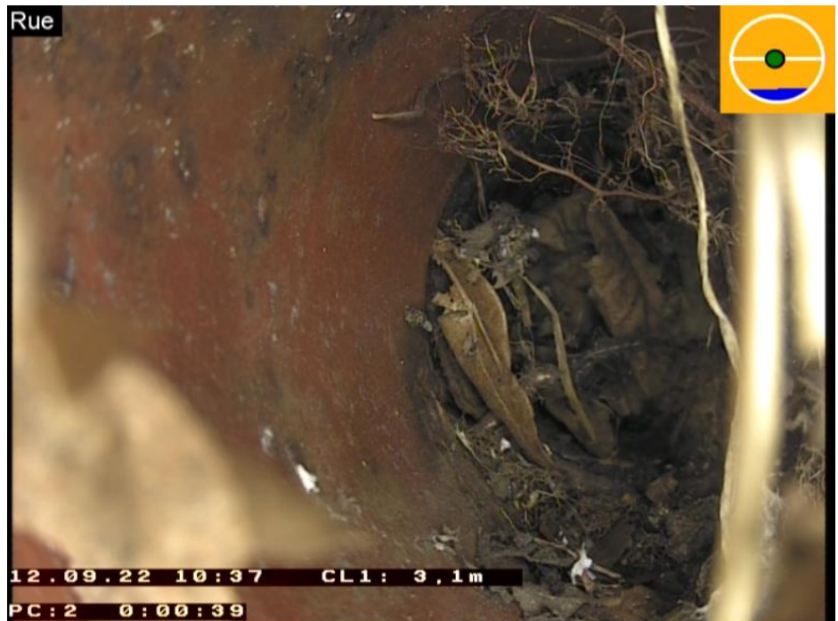
Photo 002 Vidéo 00:00:39 Distance amont 3,10 m État BBA.A Position 12 - 12 Support de donnée

Pos: 12 - 12; Racines, grosse racine isolée, Réduction de la section transversale = 50%